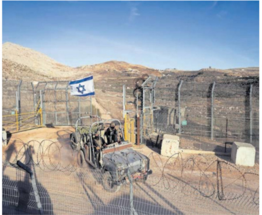
Un vehículo con militares israelíes, ayer en la zona ocupada de los Altos del Golán.

Muere Javier Echenique, vicepresidente de Telefónica —P26