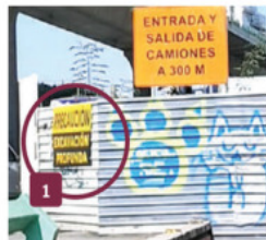
EN EL SITIO, un letrero advierte que se trata de una excavación profunda.