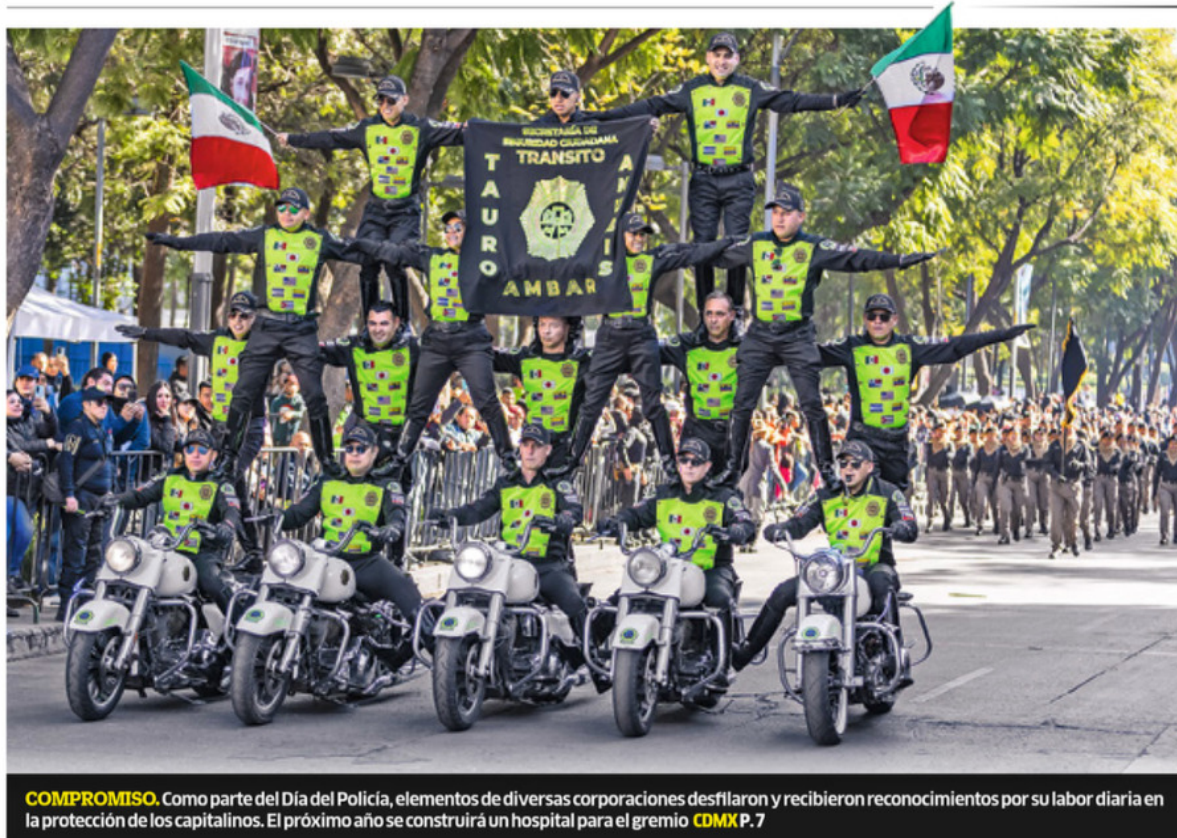
COMPROMISO. Como parte del Día del Policía, elementos de diversas corporaciones desfilaron y recibieron reconocimientos por su labor diaria en la protección de los capitalinos. El próximo año se construirá un hospital para el gremio CDMX P.7

BOLIVIA ELIGE MAGISTRADOS Y MEXICANOS ACUDEN COMO OBSERVADORES MUNDO P.17