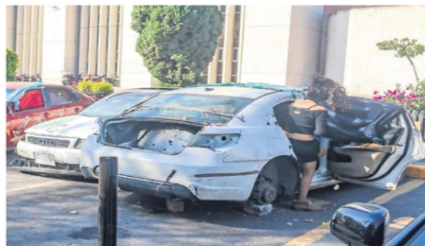
Desvalijados, los vehículos relacionados con alguna carpeta de investigación son utilizados como dormitorio por personas sin hogar o para prestar servicios sexuales.

Gerardo Fernández Noroña busca un encuentro entre ambos coordinadores para mantener la "unidad". | NACIÓN | A6