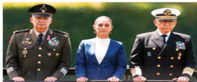
La salutación a Sheinbaum se realizó en el Campo Marte, en la CDMX, donde, en compañía de Ricardo Trevilla y Raymundo Morales, la Presidenta pasó revista a las tropas ahí desplegadas.

LA PRESIDENTA anunció que seguirá convocando a las Fuerzas Armadas a participar en las grandes obras estratégicas que emprenderá, como trenes y puertos