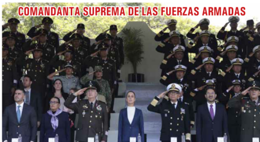
COMANDANTA SUPREMA DE LAS FUERZAS ARMADAS

La presidenta Claudia Sheinbaum, flanqueada por el General Ricardo Trevilla Trejo, titular de Sedena, y el Almirante Raymundo Pedro Morales Ángeles de Semar, durante la ceremonia de salutación de las fuerzas armadas a su Comandanta Suprema, en el Campo Marte. ▶ 11