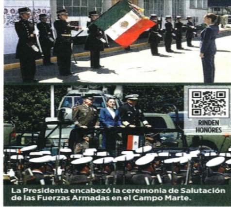
La Presidenta encabezó la ceremonia de Salutación de las Fuerzas Armadas en el Campo Marte.