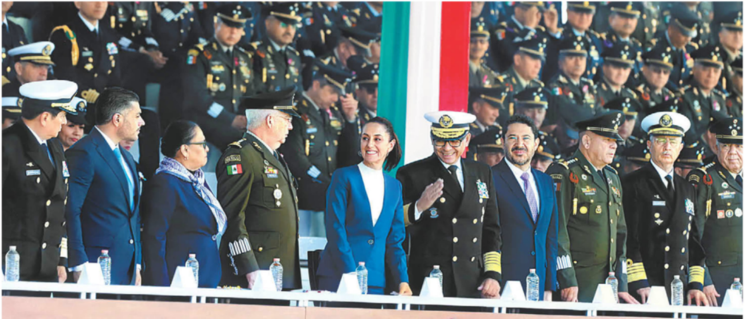
Sheinbaum, flanqueada por Omar García Harfuch, Rosa Icela Rodríguez, el general Ricardo Trevilla, el almirante Raymundo Morales y Martí Batres.

"Un gran honor, ser guiados por la comandanta"