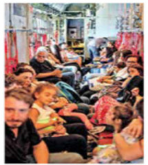
Griegos y chipriotas salieron a bordo de un avión militar.