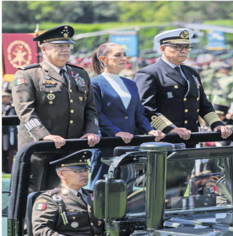
En el Campo Marte, la presidenta Claudia Sheinbaum pasó lista a militares en compañía de los titulares de la Defensa Nacional y Marina, Ricardo Trevilla (izq.) y Raymundo Pedro Morales (der.), respectivamente.

PEDRO VILLA Y CAÑA Y SALVADOR CORONA —nacion@eluniversal.com.mx