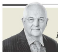
Martin Wolf "En puerta, década perdida en lucha contra la pobreza" - P. 20 Y 21