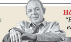
Héctor Aguilar Camín "El partido de AMLO y el PRIAN, escupiendo para arriba" - P. 3

META 2024 Otro periodo y nada de nombramientos en INAI, Tribunal, Ifetel y CNH; la 4T vio un "Congreso productivo" y para la oposición "este Senado le falló a México"