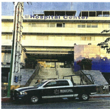
En el ataque al Hospital Center Vista Hermosa, un hombre fue rematado y otro quedó herido.